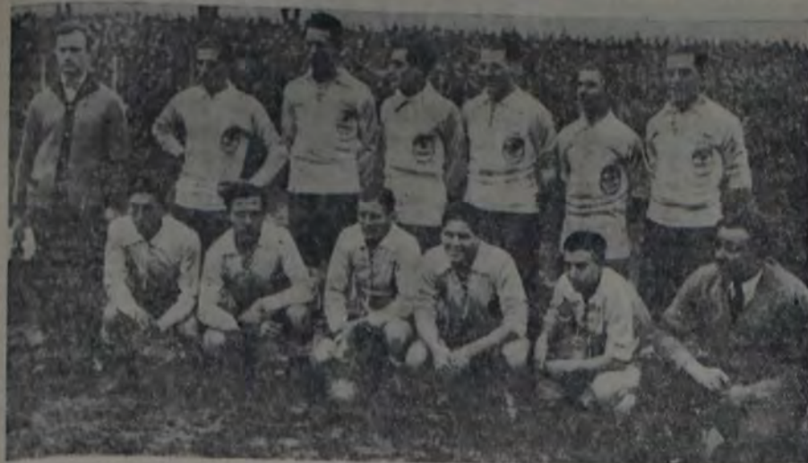
EL CONJUNTO DE LA AMATEURS ARGENTINA DE FUTBOL QUE GANO POR 3 A 1 AL BARCELONA F. C.