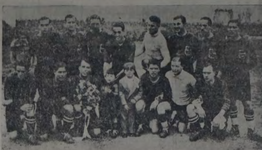
CUADRO DEL BARCELONA QUE HIZO AYER SU PRESENTACION FRENTE A UN COMBINADO LOCAL