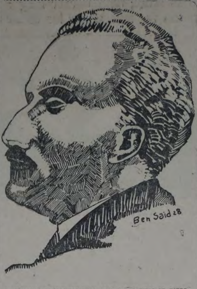
EL CONOCIDO COMPOSITOR CUYA OPERA "AFRODITA" SE ESTRENARÁ ESTA NOCHE EN EL TEATRO COLON.

El programa incluye las siguientes páginas: